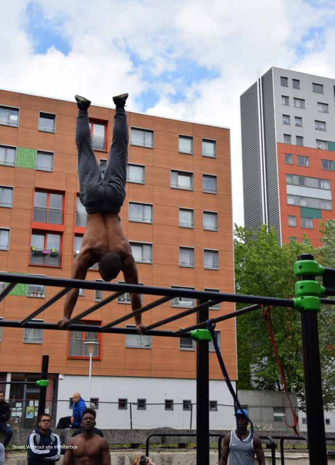
Street Workout site in Peterbos