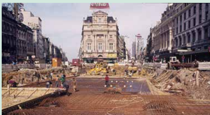
Place De Brouckère lors de la construction de la station de métro en 1974. Het De Brouckèreplein tijdens de aanleg van het metrostation in 1974

Bijna 20 jaar lang (1974-1992) speelde de 'Regroupement démocratique marocain' een centrale rol in de politieke en culturele zelforganisatie van arbeiders van Marokkaanse afkomst in België.