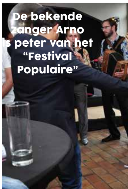
De bekende zanger Arno is pater van het “Festival Populaire”